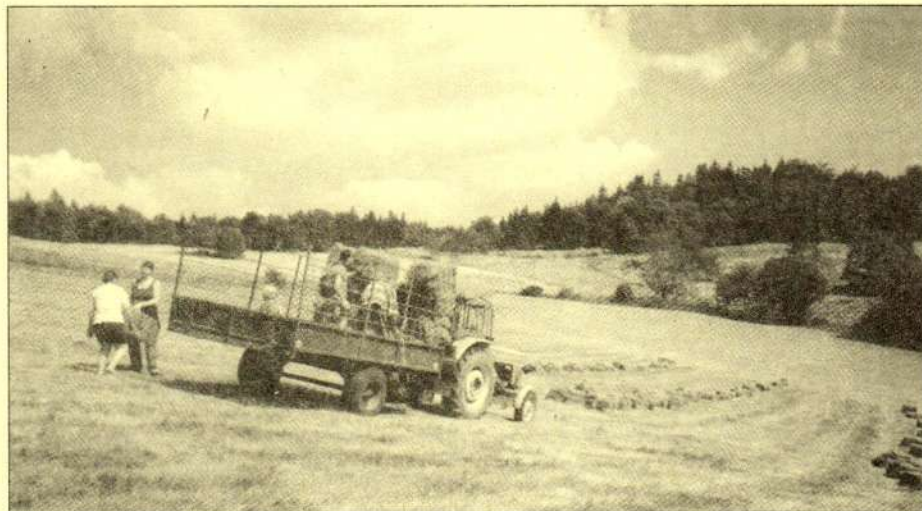
Handicapovaní obyvatelé camphillu Wojtówka na polské straně Rychlebských hor pomáhají při sklizni sena.

V Norsku se pracuje na ustavení skupiny zájemců o projekt a na sehnání financí, v první řadě k zakoupení budov a polí. Předpokládáme, že podporu nabídne i hnutí v dalších zemích. Nyní bude záležet na tom, aby se na české straně vytvořila dostatečně silná skupina, která by se ujala toho, čeho bude zapotřebí. Ke spolupráci jsou vítáni všichni lidé dobré vůle, každý může uvážit svou míru angažovanosti. Samozřejmě že celý projekt je závislý na přesvědčivě silné tuzemské účasti hlavně těch, kteří