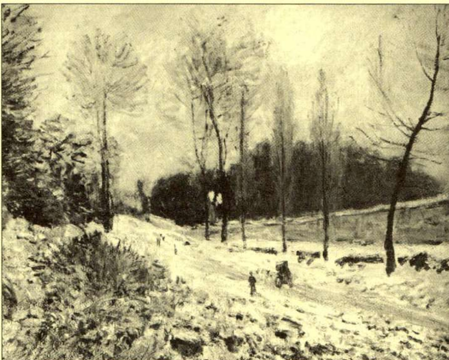
Alfred Sisley: Cesta u Louveciennes

Při zakládání křoví bychom měli též počítat s omezeními, která vzniknou. Na paměti je dobré mít, že křoviska zaberou nejen vlastní místo pro vysazení, ale druhotně později ovlivní okolí také zastíněním sousedního pozemku. Orientačně se uvádí že do vzdálenosti do jaké dorostou výšky. Tedy pás se stromy vzrůstnými pak zastíní značnou plochu. Některé druhy mohou být též potenciálně přenašeči či mezihostiteli chorob některých zemědělských plodin apod.