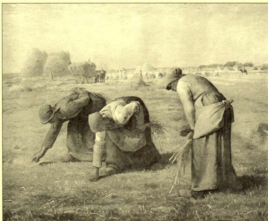
Jean-Francois Millet: Sběračky klásků

Obtížnost dnešní "výchozí situace" spočívá podle Steinera v tom, že člověk, směřuje-li svou pozornost na smyslové dojmy světa, nalézá v prožitku svých myšlenek vlastně jen sám sebe, tzn. že člověk v myšlení ztrácí svět a prožívá sám sebe. Naopak, směřuje-li člověk svou pozornost na sebe a svůj osud, může prožít vlastní bytí jako výsledek toho, co ho potkalo. Jako východisko z této situace ukazuje Rudolf Steiner možnost rozvíjení rozšířené schopnosti myšlení: "Neboť anthroposofie uplatňuje toto: Existuje duchovní prožívání, které neztrácí svět v myšlení. I v myšle-