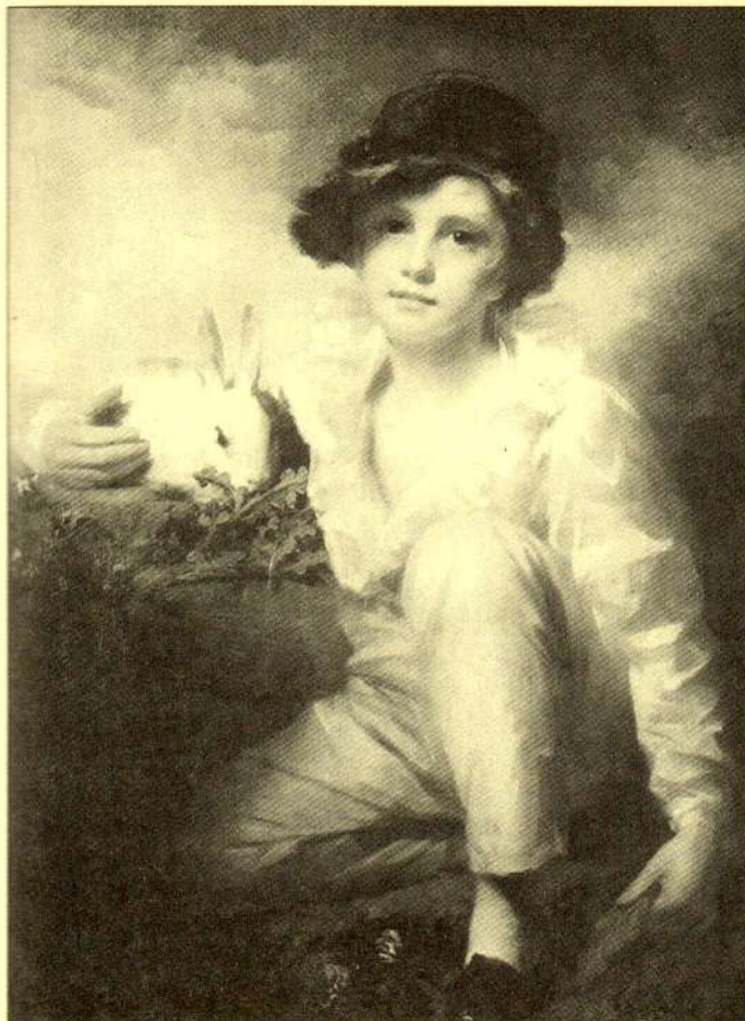
Henry Raeburn: Chlapec s králíkem