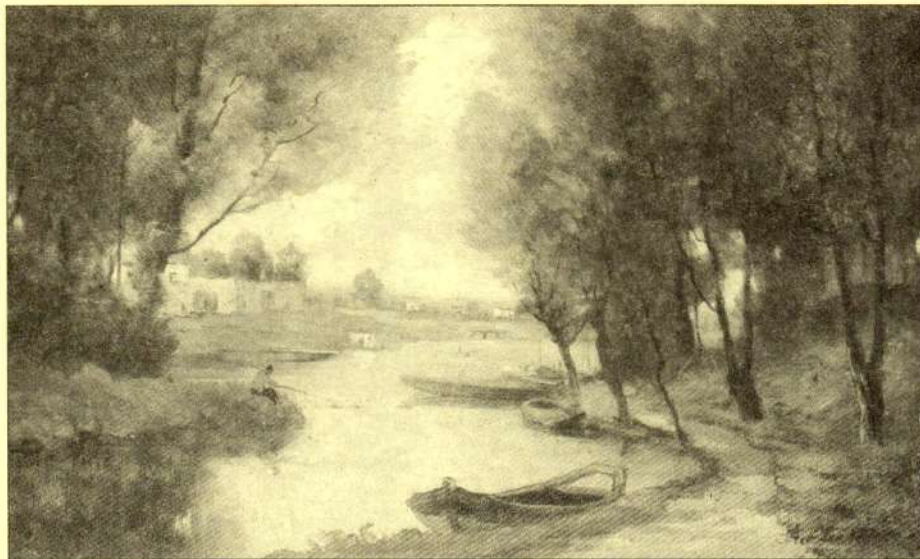
Antonín Chittussi: Říční krajina

V dalším roce můžeme příp. dosadit nové rostliny na místo neujatých. Po vzrůstu