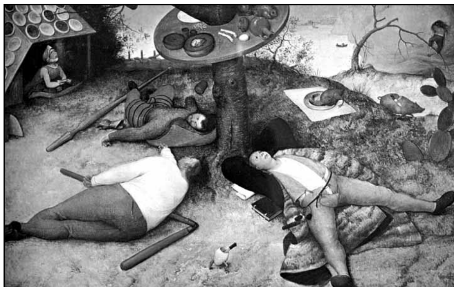
Pieter Bruegel starší: V zemi peciválů

Člověk se zaraženě ptá: Neprožili jsme snad ve Třetí říši podobný davový fenomén, mladí jako staří, a sice nikoli jakožto tanec,