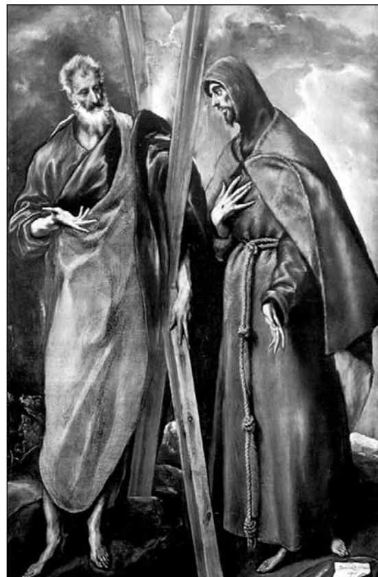
El Greco: Sv. Ondřej a sv. František

Všem čtenářům Valeriany přeje za celou redakci napínavé, poučné a inspirující čtení