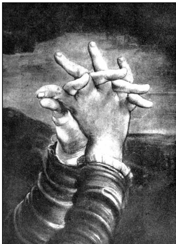
Mathias Grünewald: Isenheimský oltář, detail (Ruce)

Na přelomu 19. a 20. století doufalo mnoho lidí v sekulum pokroku a humanity. „Chicago Tribune“ tak 1. ledna 1901 píše: