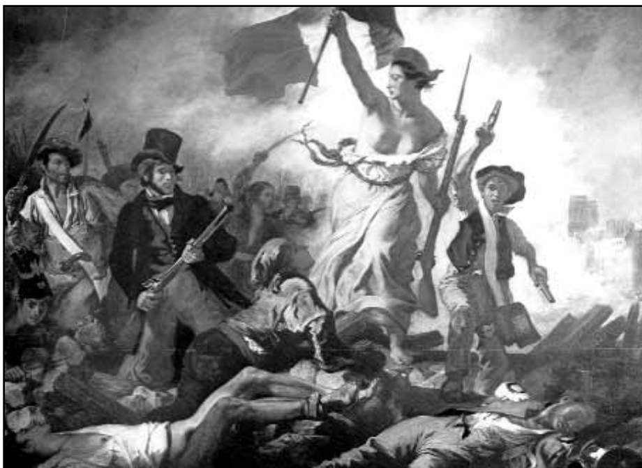
Eugène Delacroix: Svoboda vedoucí lid

samopalů, nýbrž duchovní mocí . Touto duchovní mocí je pro Havla ideologie neboli jinými slovy strašidlo lži . Nátlak, který určité ideje a představy vyvíjely na každého člověka, nedal existovat pravdě, nepřipustil artikulaci skutečných intencí života. Život, je-li mu dána volnost, tíhne k pluralitě, k mnohobarevnosti a mnohotvárnosti, k sebeorganizaci a decentralizaci. Systém si však žádá monolitickou jednotvárnost, totální organizaci, monotonii a hlídání. Ideologie slouží k tomu, aby tento rozpor mezi životem a vůlí systému zastírala. Skutečné zájmy života a pokusy o jejich artikulaci musí být nemilosrdně pronásledovány, protože ohrožují sebezachování systému. (...)