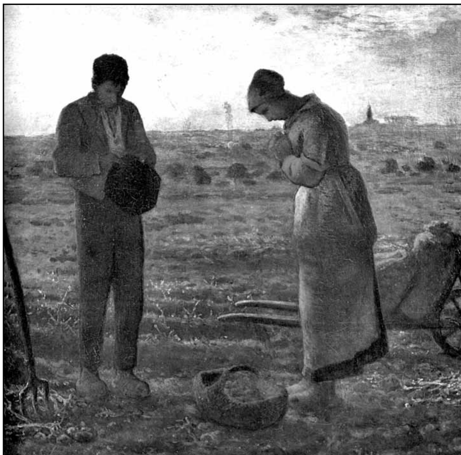
Francois Millet: Klekání

A přece právě na půdě českého království došlo k jedněm z prvních pokusů ve středověku o rovnost a bratrství mezi lidmi. Kádě na náměstí nově založeného Tábora,