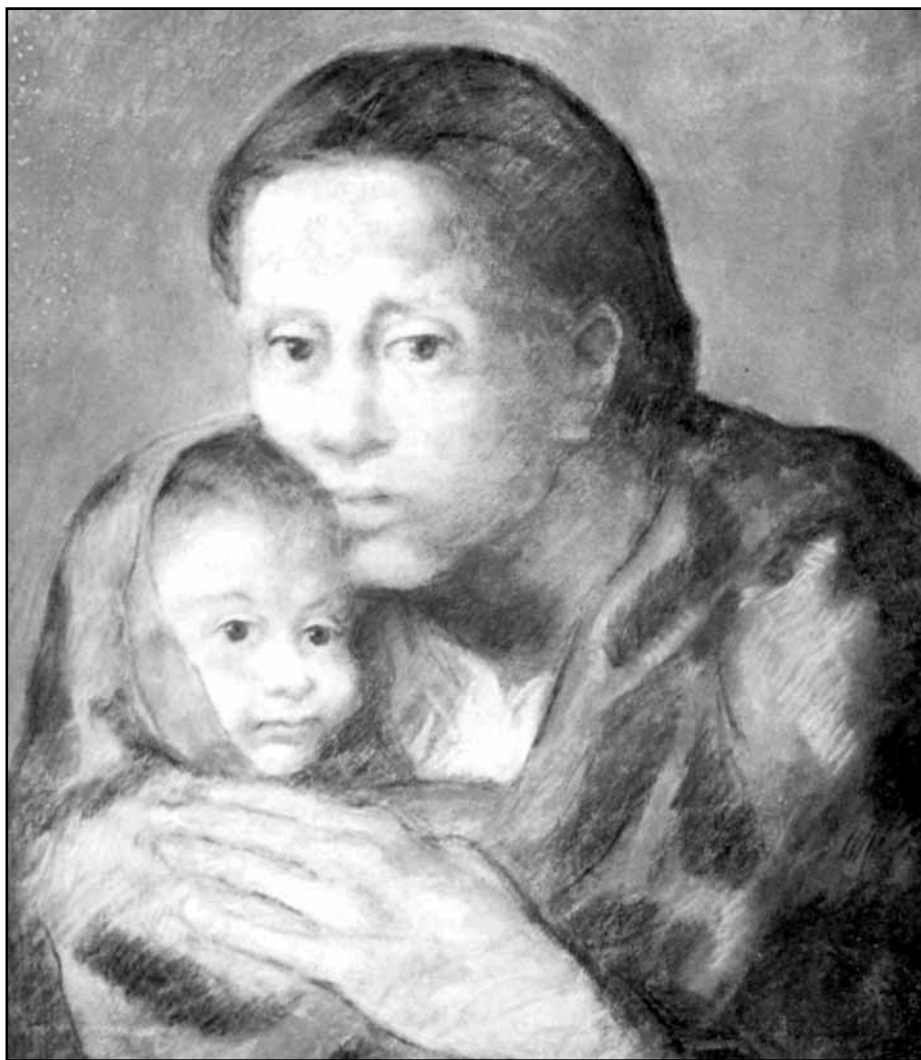
Pablo Picasso: Beznaděj

Toto Já - ono bytostné jádro člověka - je tím, co jej činí jedinečnou individualitou, subjektem svého vlastního vývoje a co jej pozvedá nad zvířectví. Zároveň je však toto Já také tím, skrze co se člověk může ztratit v egoismu. Aby charakterizoval tuto ambivalenci, používá Rudolf Steiner jednoho obrazu z Apokalypsy, jehož prostřednictvím se zároveň stává zřejmým, jak vývoj Já souvisí se „Synem člověka“, obraz dvoustranného meče (v českých překladech Bible překládán jako meč ostrý - pozn. rh.). „Syn člověka“ je ona bytost, díky které člověk nemusí ve vývoji Já nalézt duchovní smrt ustrnutím