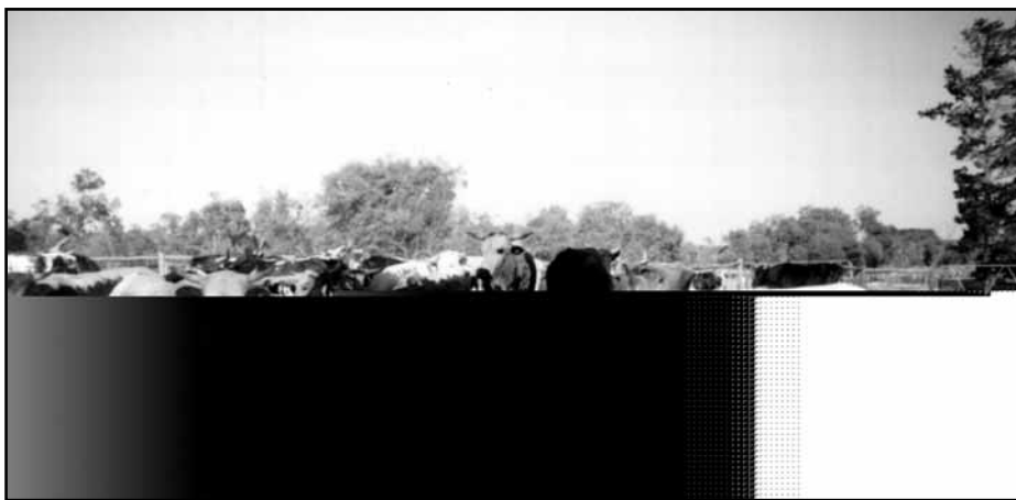
Stádo afrických krav Ngunis