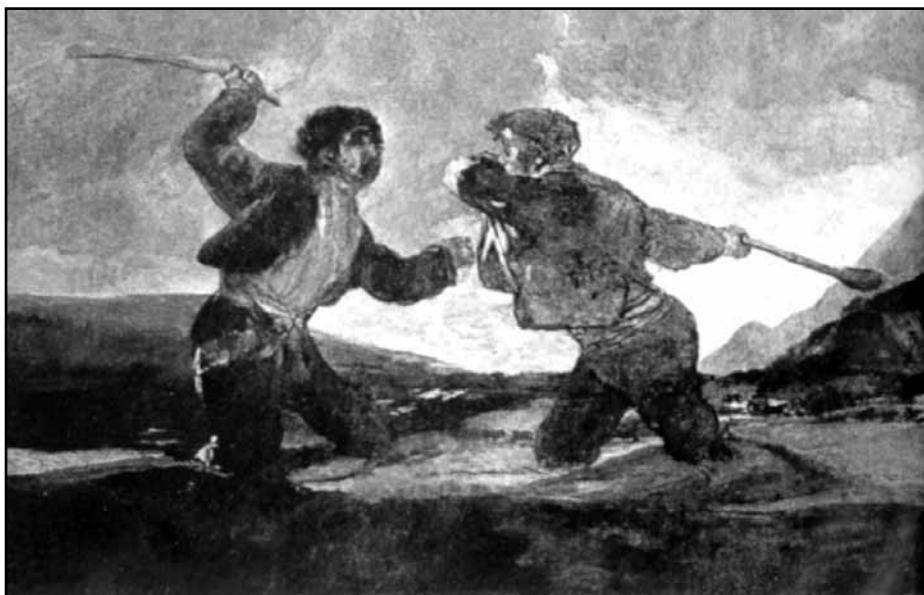
Francisco Goya: Dva cizinci

Působivé, svou dalekosáhlou nenásilností bezpříkladné revoluce, které se v uplynulých měsících odehrály ve východní Evropě a na východě Evropy střední, by snad bylo možno interpretovat jako důkaz dvou skutečností. Dokázaly za prvé, že se lidská vůle ke svobodě nedá potlačit dlouhodobě. Dá se možná přechodně utlumit, její artikulaci v jednotlivých lidech lze chvilkově zabránit jejich odstraněním: odindividualizovanou nucenou nadvládou však nelze ujařmit celé národy v průběhu generací. - Za druhé podaly tyto prudké přeměny reálné his-