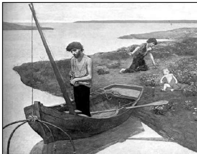
Pierre Puvis: Chudý rybář

S tímto volným časem lze nyní naložit různě. Stolař, který díky použití hoblovačky