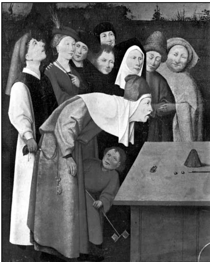
Hieronymus Bosch: Eskamotér, detail

Část peněz, které každý z nás vydělává, nevydáváme okamžitě za účelem konzumu, ale z různých důvodů ji uspoříme. Spoření jako takové však vede celospolečensky k následujícímu problému: Peníze strčené do slamníku by byly penězi „zablokovanými“, penězi, které byly staženy z oběhu a nebyly dány k dispozici jako kupní síla, pohánějící nové výkony. Proto jsou uspořené peníze, většinou prostřednictvím bank, proměňovány na kredity neboli úvěry a uváděny tak opět do pohybu. Slovo „kredit“ pochází z latinského