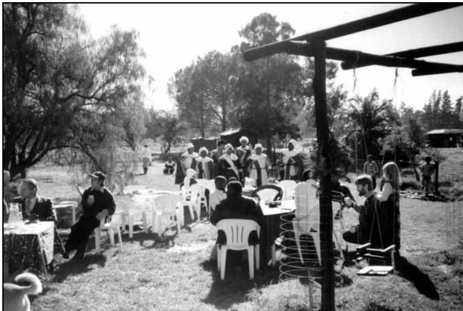
Komunita Alpha: Zahradní slavnost a křtiny

V lednu minulého roku jsem se proto vydala do Jihoafrické republiky do camphillové vesničky Alpha. Nedaleko Kapského Města tam na mne čekala komunita s 17 domy, asi 90 vesničany, s nádhernou biodynamickou farmou o rozloze 246 hektarů, mlékárnou, zahradou, dílnou na výrobu kosmetiky, košíků, pekárnou, vlastním obchůdkem, ale také s křesťanskou komunitou s malou kapličkou a milým knězem, který byl vždy ochotný vyslechnout naše problémy a poradit nám. V Alphě jsem si uvědomila, jak může být obyčejný venkovský život pestrý a bohatý. Na rozdíl od Dunshane africká komunita nedostává téměř žádné příspěvky od státu, ale díky snaze celé komunity, dobré organizovanosti a rozváznému přístupu k finančním záležitostem Alpha hospodaří velice dobře. Každá dílna si vydělává sama na sebe a přispívá také do společného fondu, který pomáhá financovat jednotlivé domy s rodinami. Mlékárenské výrobky, maso z vlastních malých jatek, med, vajíčka, zelenina, kosmetika, košíkářské a pekařské výrobky se několikrát týdně rozvázejí do nemalého počtu obchodů v Kapském Městě. Každý měsíc se v komunitě pořádá velký trh, který navštěvují lidé z celého okolí, a i to přispívá částečně do pokladny. Trhy ale nejsou určeny jen na prodej produktů z Alphy. Návštěvníci tam