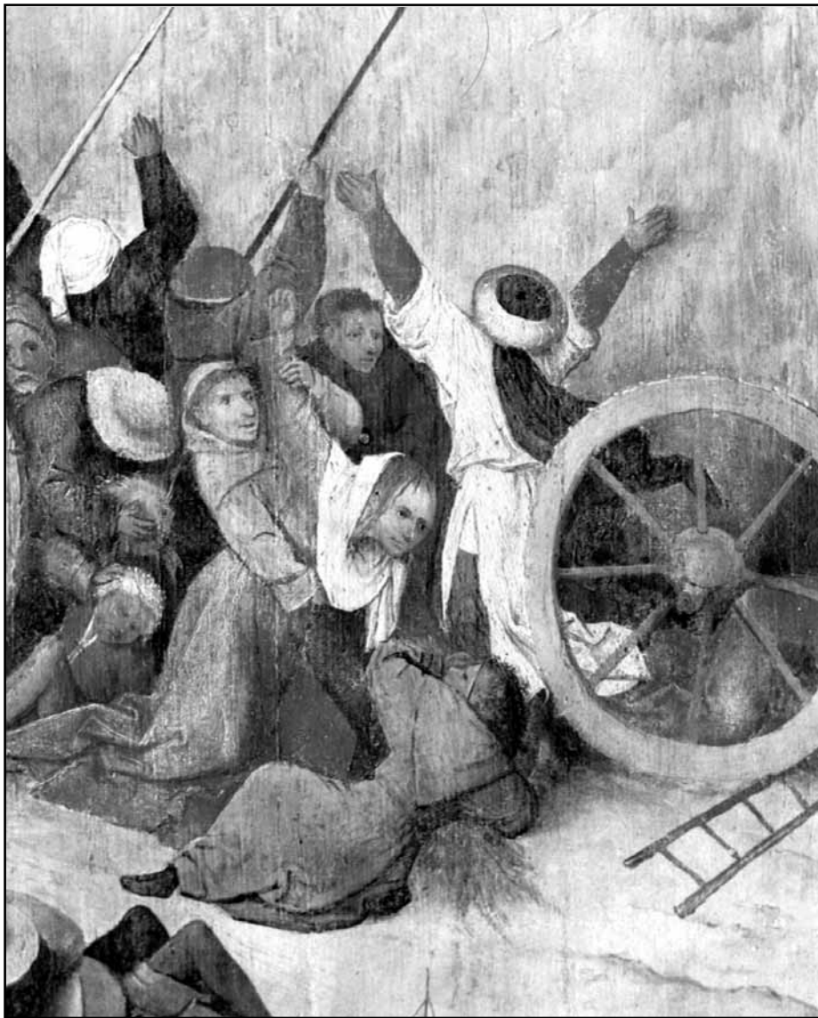
Hieronymus Bosch: Fura sena, detail

Každý svěřenec má své konto na které dostává cca 2000 Nkr měsíčně. Disponování konta je závislé na jejich schopnostech.