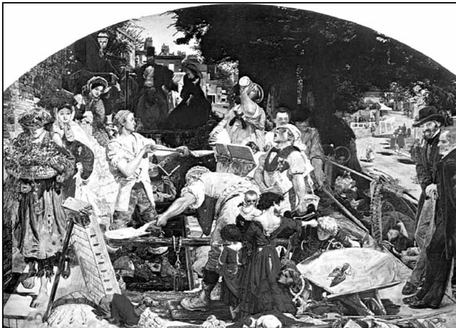
Ford Madox Brown: Práce

a jiných strojů zhotoví jednu skříň v polovičním čase, může takto získaného půl dne na jeden pracovní den využít k tomu, že půjde na procházku, čímž udělá něco pro své zdraví, že složí báseň, čímž udělá něco pro svůj duchovní život, nebo že převezme úřad starosty, čímž slouží životu právnímu.